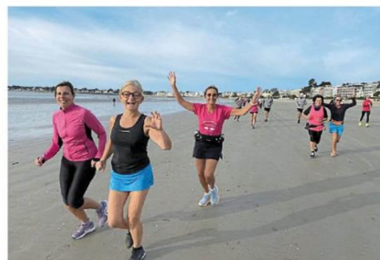
Octobre rose 2023. Le rendez-vous était pris pour le 20 octobre 2024.